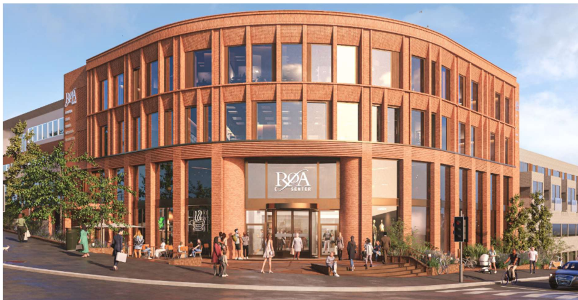
Figur 1 Illustrasjon Nye Røa Senter (LINK Arkitektur)

Arbeidet skal utføres av totalentreprenøren Varden Entreprenør på vegne av utbygger, Røa Senter AS. Prosjektet er planlagt ferdigstilt høsten 2027.